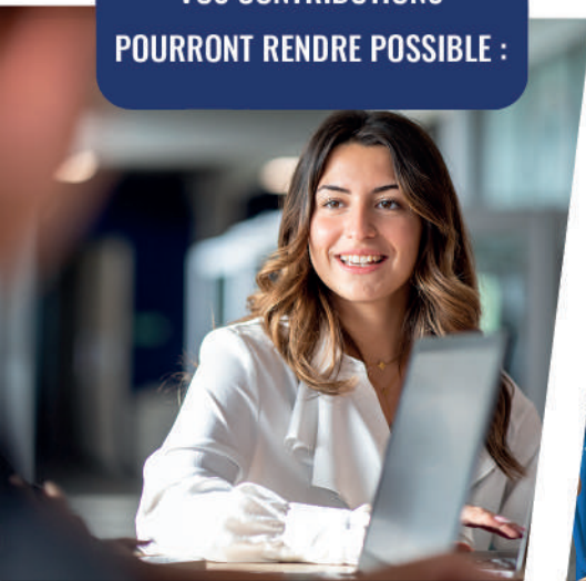
L'achat de matériel pédagogique

VOS CONTRIBUTIONS POURRONT RENDRE POSSIBLE :