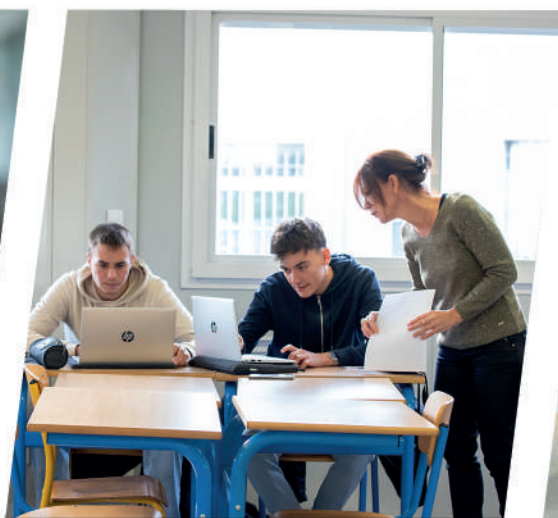
Le développement de nos outils numériques