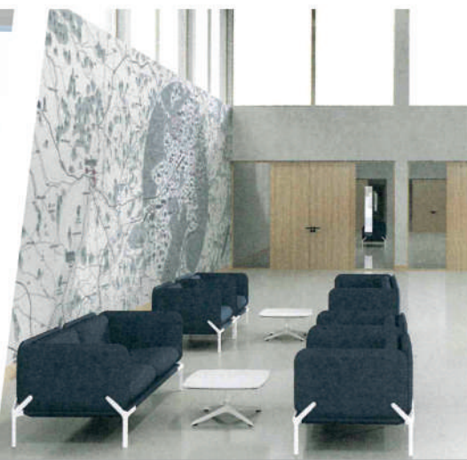
La construction d'un campus moderne